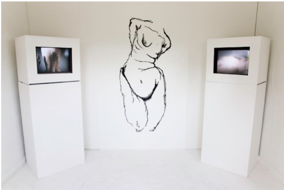
Milan Anais Groot, Functionality and what I'm capable of