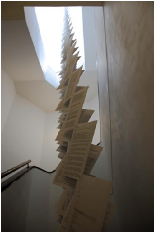
Jason File, Conditions of Performance