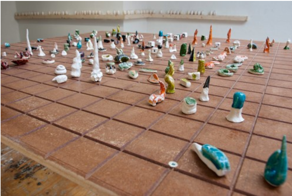
Malyssa ten Hove